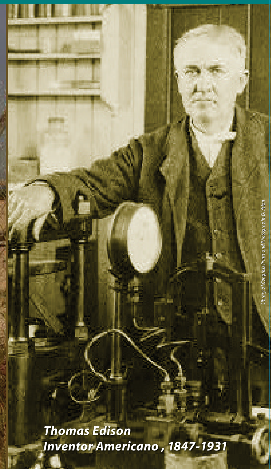
Thomas Edison Inventor Americano , 1847-1931